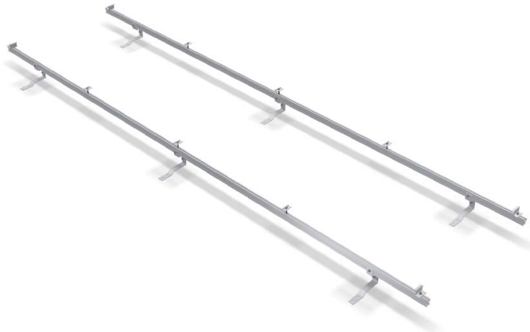
Estructura formada por perfiles RCVE 4.0 y fijación kit salvatejas