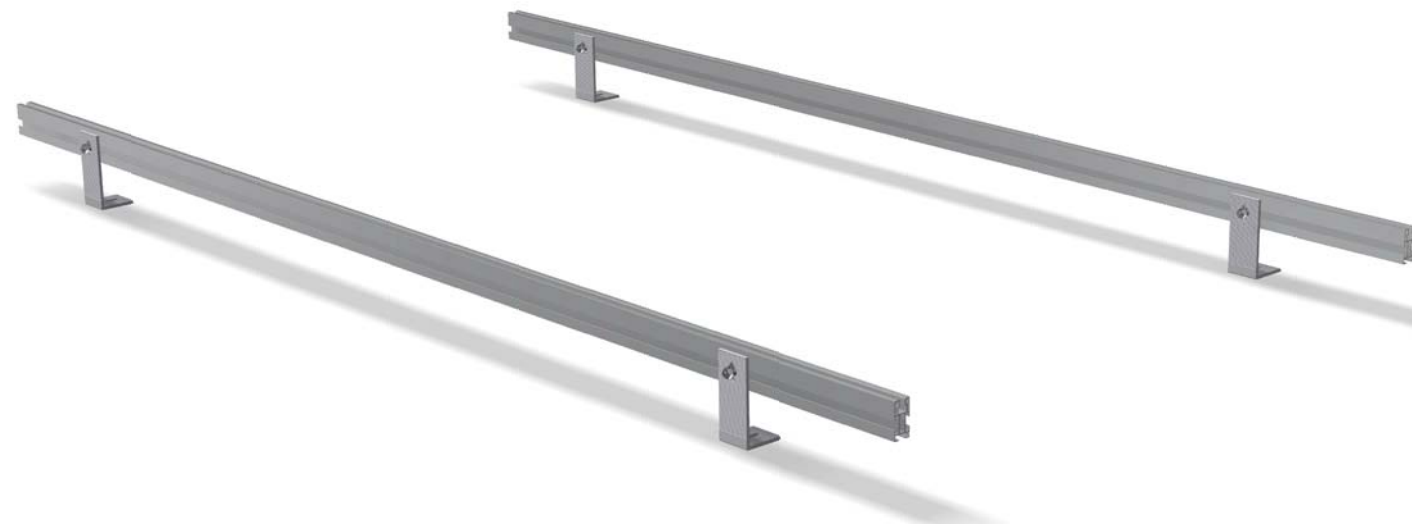
Estructura formada por perfiles RCVE 4.0 y fijación L120